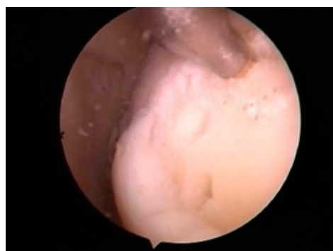
Illustrazione 3: Trattamento condrale