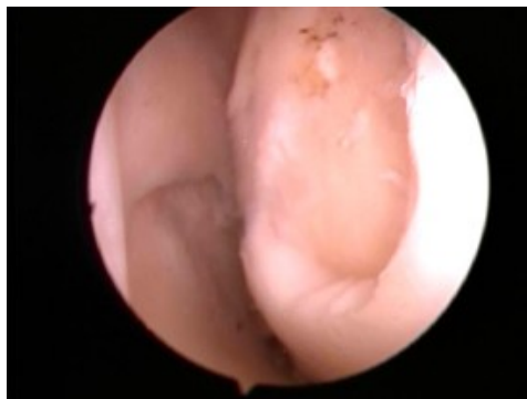
Illustrazione 1: Trattamento condrale

Va precisato che qualunque trattamento condrale presuppone la presenza di una lesione che, per quanto ampia, sia circondata da tessuto cartilagineo sano. E' possibile pertanto il trattamento di lesioni isolate e non di lesioni diffuse, come accade nella artrosi.